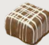
ROTE JOHANNISBEERE VOLLMILCH