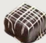
ROTE JOHANNISBEERE DUNKEL